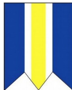
Obrázok 3 Vlajka obce

Vlajka obce pozostáva z troch pozdĺžnych pruhov vo farbách striedavo modrej, bielej a žltej a to v takomto poradí zhora: 3/10 modrá, 1/10 biela, 2/10 žltá, 1/10 biela, 3/10 modrá s dvoma zárezmi. (Obrázok 3)