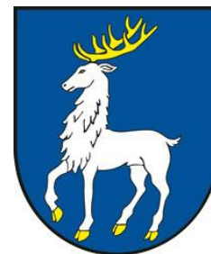
Obrázok 2 Erb obce Horovce

Erb obce Horovce tvorí v modrom štíte kráčajúci strieborný jeleň v zlatej zbroji.