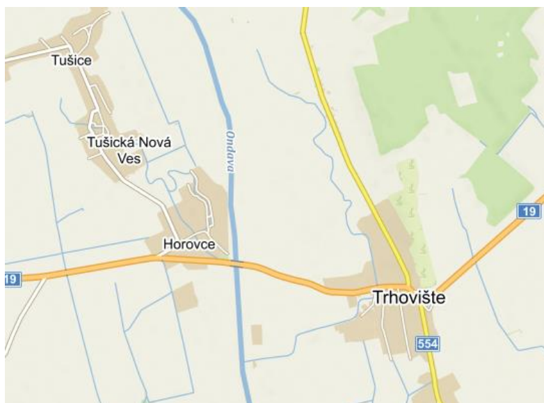
Obrázok 1 Mapa polohy obce

Obec Horovce leží tesne pri brehoch rieky Ondavy zo západnej strany, uprostred Východoslovenskej nížiny na agradačnom vale Ondavy, juhozápadne od okresného mesta Michalovce a severovýchodne od okresného mesta Trebišov v Košickom samosprávnom kraji. Susedí s katastrálnym územím obce Vojčice, s katastrálnym územím obce Tušická Nová Ves, Moravany, Trhovište a Bánovce nad Ondavou.